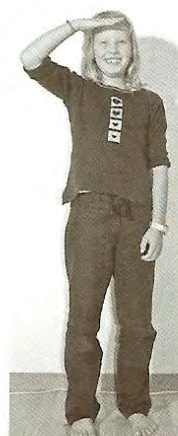
Has sälber gseh!